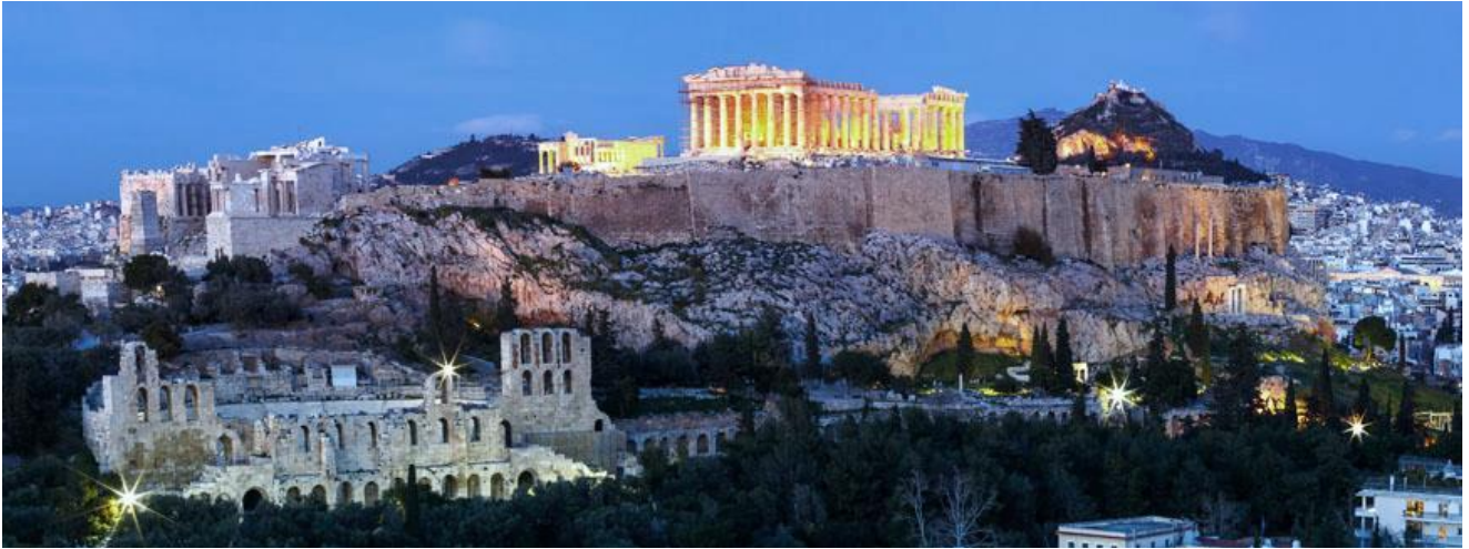
Acropolis & Parthenon