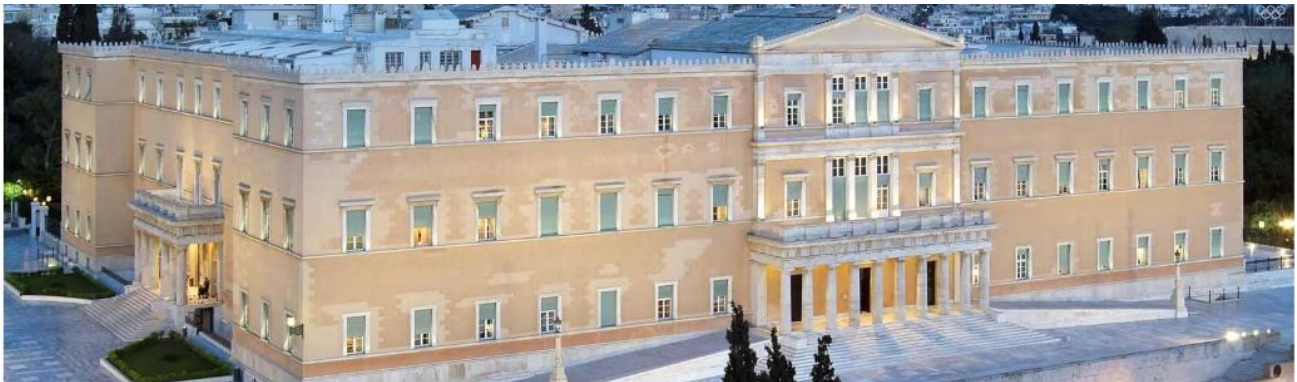
Syntagma · Hellenic Parliament

04 Drunky Goat Greek wine & tapas 4 min · +30 210 3319966