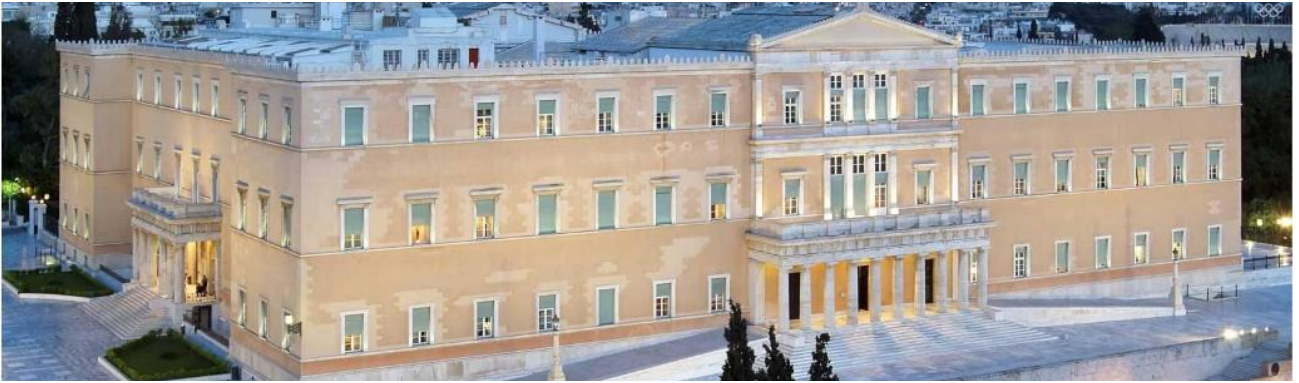
Syntagma · Hellenic Parliament